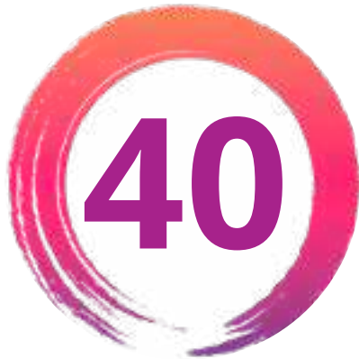
Figure 1. Les 40 actions ciblées pour l'intégration du handicap réparties en 10 points d'entrée stratégiques